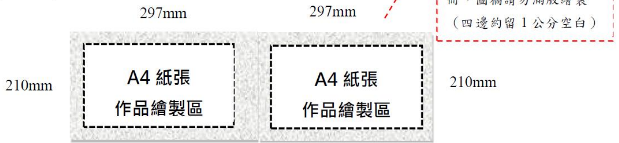
圖 2 作品紙張規格示意圖 (1 組 = 兩頁)